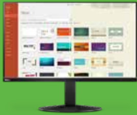
Monitor ThinkVision P32u-10 com certificação TÜV Eye Comfort