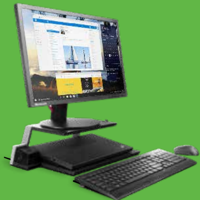
Suporte para notebook de plataforma dupla com ThinkPad e monitor ThinkVision