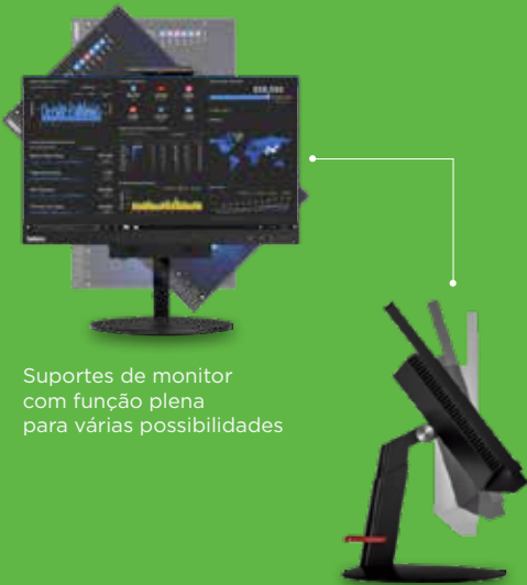
Suportes de monitor com função plena para várias possibilidades