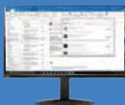
Monitores sem bordas