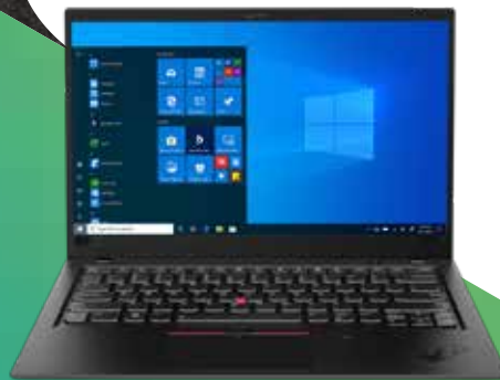
ThinkPad® X1 Carbon

PC-Teile, die an unser Servicecenter zurückgeschickt werden, für eine weitere Verwendung repariert. 2