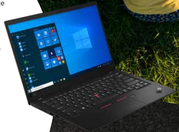
ThinkPad® X1 Carbon

We streven ernaar energiezuinige producten te leveren, nu en in de toekomst. Het Intel® Evo™-platform maakt snelle activering en een lange batterijduur mogelijk met de Intel® Core™ vPro®-processors in Lenovo ThinkPad®-laptops, zoals de X1 Carbon. Daarnaast zullen Lenovo-laptops tegen 2030 30% efficiënter zijn. 2