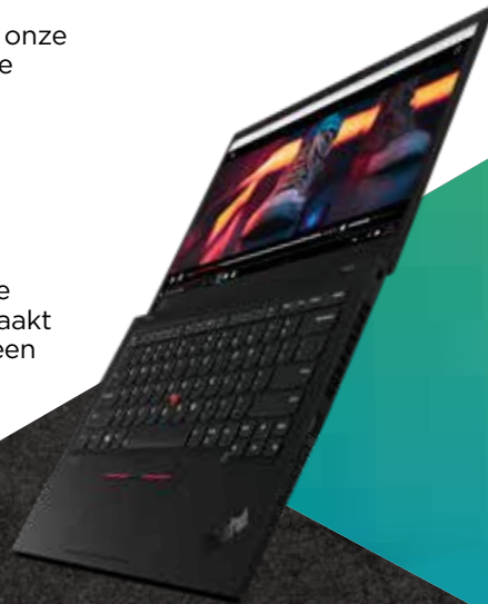
ThinkPad® X1 Carbon

Sinds 2018 hebben we meer dan 12 miljoen pond aan PCC met een gesloten kringloop gebruikt in 66 verschillende Lenovo-producten.