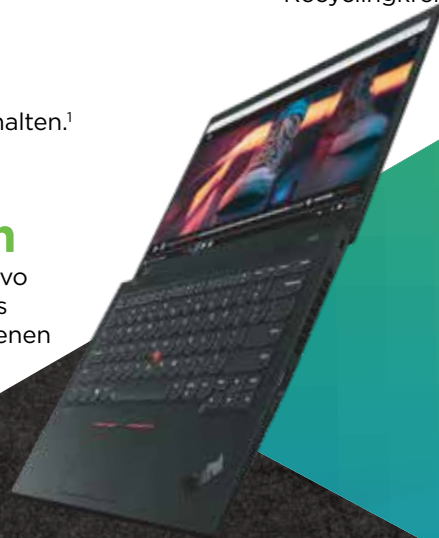
ThinkPad® X1 Carbon

Lernen Sie das erste Lenovo Notebook kennen, das aus Materialien aus geschlossenen Recyclingkreisläufen hergestellt wurde.