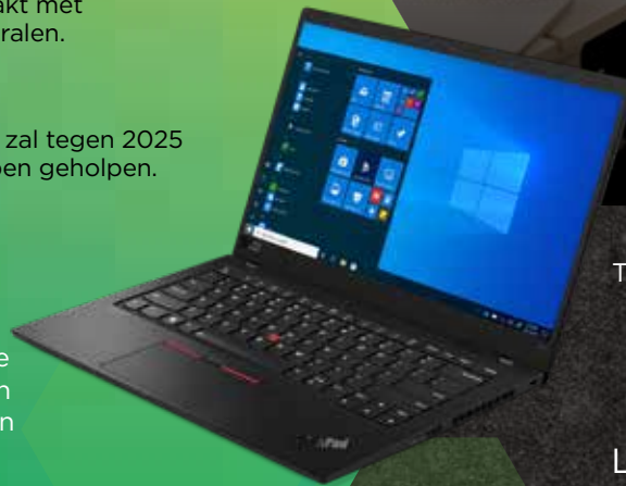
ThinkPad® X1 Carbon

Lees meer over onze inspanningen op het gebied van milieu, maatschappij en bestuur op www.lenovo.com/esg .